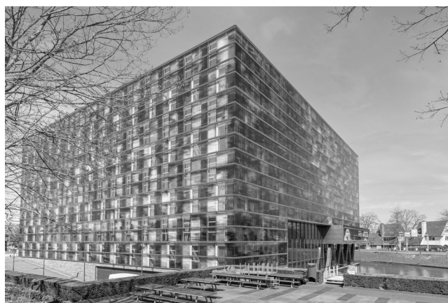
Beeld & Geluid in Hilversum

De programma's op de Nederlandse televisie worden uitgezonden door publieke omroepen en commerciële omroepen. Publieke omroepen worden gefinancierd door de overheid en commerciële omroepen hebben winst maken als doel. Er zijn zes landelijke, publieke omroepen, waarvan AVROTROS en BNNVARA de twee grootste zijn.